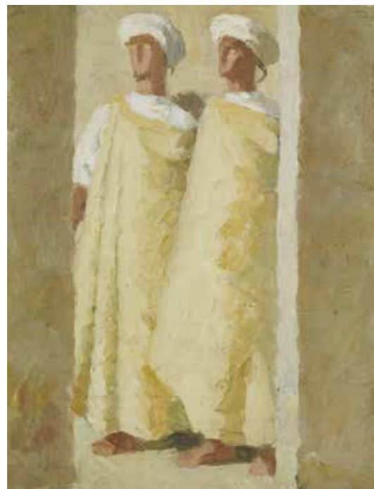
Marthe Flandrin, Marocains du Moyen Atlas, huile sur toile marouflée sur carton, 33 x 24 cm, Inv.97.37, collection Beauvais, Mudo-musée de l'Oise

Palais Lumière, durée 2h. Atelier précédé d'une courte visite de l'exposition. 5 € / personne et 55 € / groupe. Peut être proposé à des groupes seniors EHPAD, CCAS, etc. (accompagnateurs gratuits).