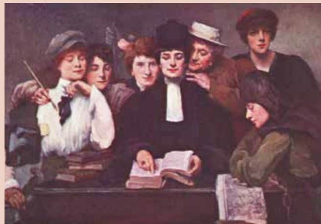
Amélie Beaury Saurel, Les Eclaireuses , 1914, carte postale, collection bibliothèque Marguerite Durand © Ville de Paris, Bibliothèque Marguerite Durand