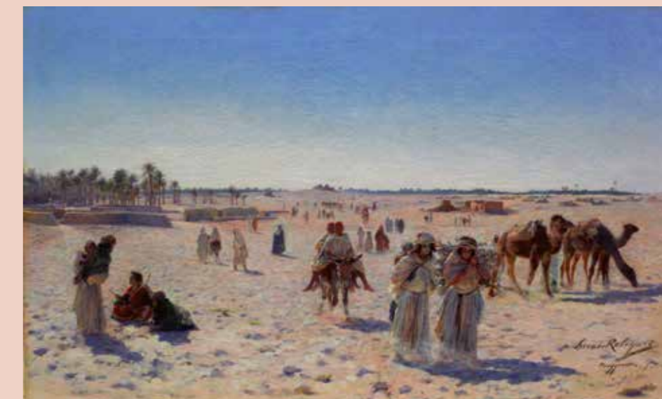
Marie Aimée Lucas-Robiquet, La Route de Temacine, Touggourt (Algérie) , 1896, huile sur toile, 61 x 100 cm, Inv. FNAC 650, collection Paris, CNAP

(6-12 ans) Les enfants créent un carnet de voyage et retranscrivent en technique mixte (dessin, écriture, collage) leurs voyages passés ou rêvés. Palais Lumière, Deux demi-journées de 2h/jour, 14-16h. Atelier précédé d'une courte visite de l'exposition (30 min). 10 € / enfant.