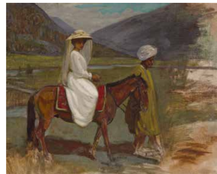
Andrée Karpelès, Bob , sans date, huile sur toile, 60 x 72 cm, collection particulière © François Fernandez. DR

(6-12 ans). Ensemble, les enfants imaginent un monde imaginaire où ils aimeraient voyager, puis le composent en dessin et papier pour aboutir à une œuvre collective évolutive. A la fin, chacun repart avec un fragment de cette mappemonde inventée. Palais Lumière, 10-12h. Atelier précédé d'une courte visite de l'exposition (30 min). 5 € / enfant.