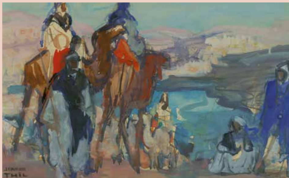
Jeanne Thil, Kasserine, 1921, Aquarelle sur papier, 17,5 x 27,5 cm, collection particulière

Durée: 2h dont 30 mn visite de l'exposition, 55 € / groupe. Sur réservation: 04 50 83 10 19 courrier@ville-evian.fr . Programme pédagogique sur www.ville-evian.fr