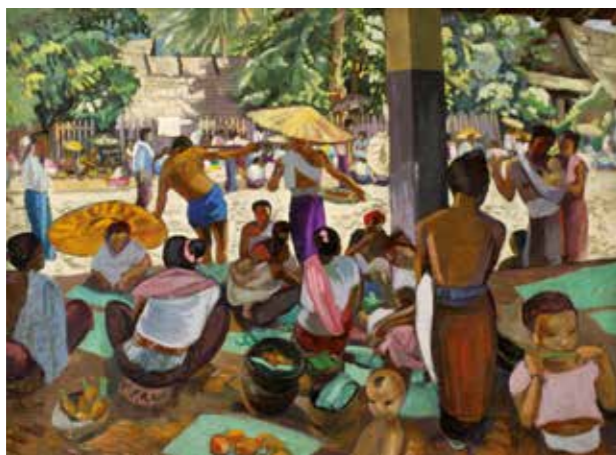
Alix Aymé, Marché Laos , ca.1930, huile sur toile, 54 x 73 cm, collection Pascal Lacombe

Palais Lumière, 16h (45 mn). Gratuit pour les enfants et 6,50€ / adulte.