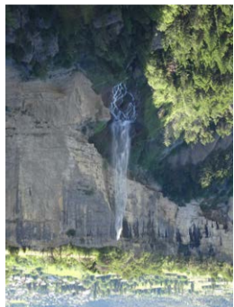
Guillestre, fin du canal de la Chap, vu depuis Mont- Daphin