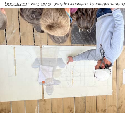
Embrun, cathédrale, le chœur expliqué - © AG. Court, CCSP / CCGQ

Au XVI e siècle, l'orgue prend son essor dans le nord de l'Europe, bénéficiant du développement du protestantisme. Que l'expression soit religieuse ou profane, elle est caractérisée par des musiques à la construction plus élaborée, qui engendreront les grandes pages d'un Bach ou d'un Vivaldi. Org. Ville d'Embrun et Faroise de l'Embrunais-Savoins