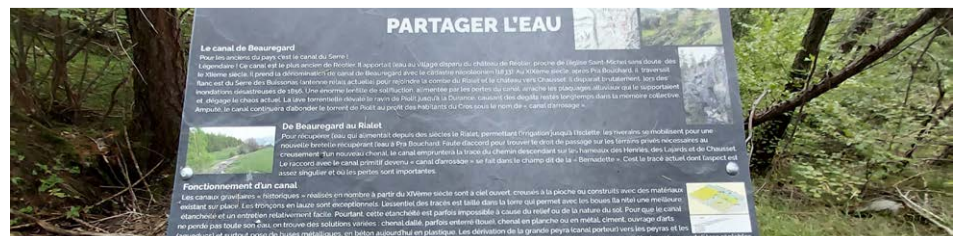
Réotier, panneau d'interprétation du canal de Beauregard