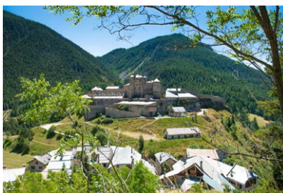
Château-Ville-Vieille, Fort-Queyras

Circuit avec visite de la microcentrale du Rif Bel puis sur le canal de la Chalp : comprendre les enjeux énergétiques et agricoles. Durée : 1h30. Org. Pays Guillestrin / ASA des canaux de Guillestre