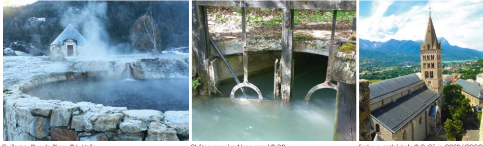
Guillestre, Plan de Phazy | Châteauroux-les-Alpes, canal | Embrun, cathédrale