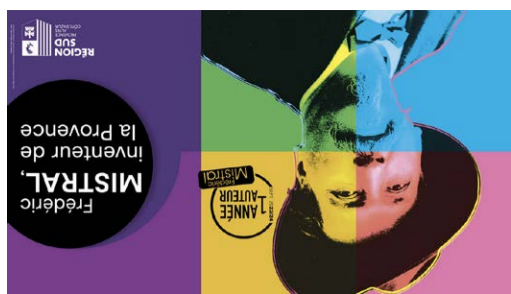
André Frédéric Mistral