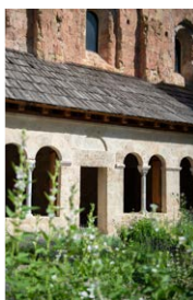
Crots, abbaye de Boscodon