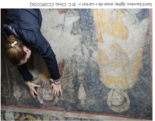
Saint-Sauveur, église, essai de « carton »