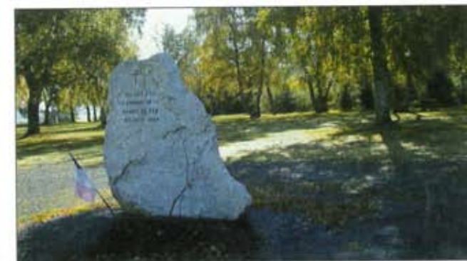
La stèle de la "barre de fer"

C'est le 20 juin 1944 que les troupes allemandes portent leur attaque sur le Réduit de la Truyère. Anterrieux est bombardé, les villageois se réfugient dans les ravins alentours (où ils resteront cachés plusieurs jours) et la 7ème Compagnie, après un combat soutenu, doit se retirer, laissant derrière elle une trentaine de ses hommes, morts au combat. 17 d'entre eux