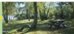
Table de pique-nique à "la barre de fer"

5 Prendre le chemin sur la droite et le suivre jusqu'au lotissement où l'on arrive sur la route. Prendre à droite pour rejoindre le départ.