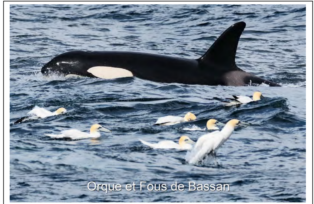
Orque et Fous de Bassan