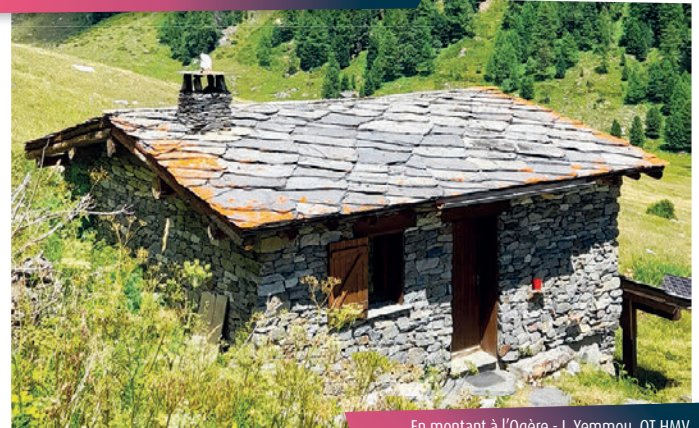
En montant à l'Orgère - I. Yemmu, OT HMV

En une ou deux étapes, le plaisir de l'évasion ne sera pas une option.