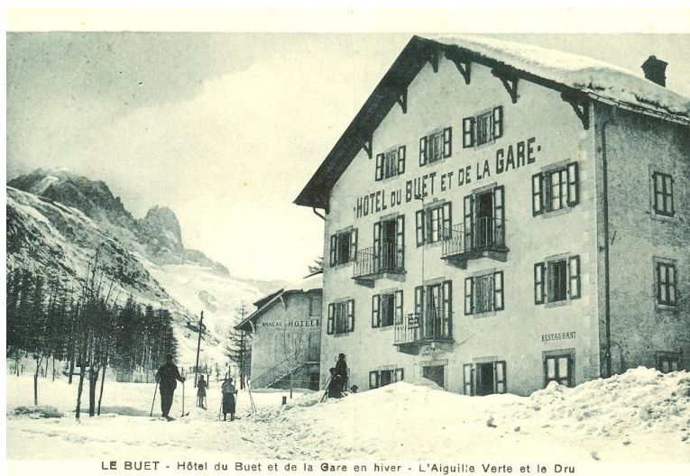
LE BUËT - Hôtel du Buët et de la Gare en hiver - L'Aiguille Verte et le Dru