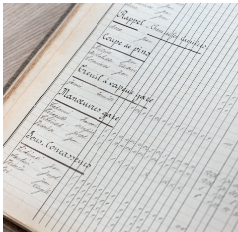
Le registre des Carriers