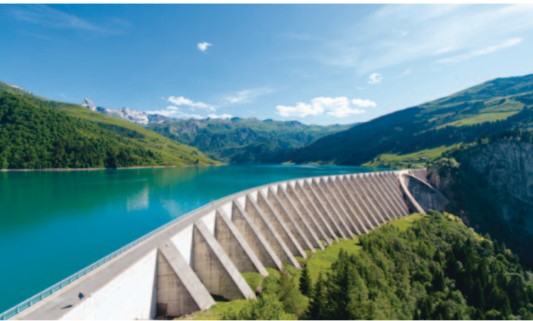
Barrage de Roselend