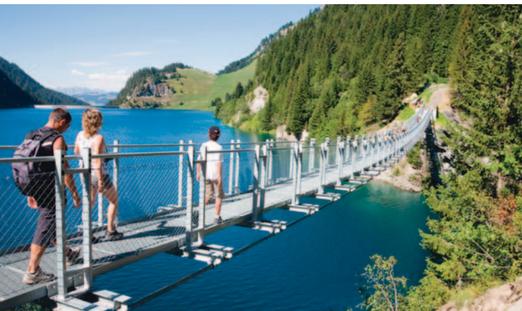
Passerelle de Saint-Guérin