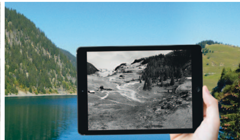
Vue avant le barrage