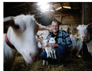
Ferme de Plantimay

ou sur la carte de la Route des Savoir-Faire et des Sites Culturels (disponible gratuitement dans les offices de tourisme du massif).