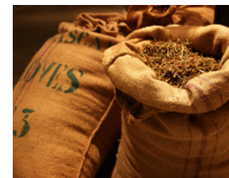
Caves de Chartreuse