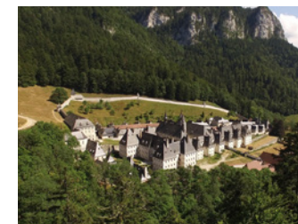
Musée de la Grande Chartreuse