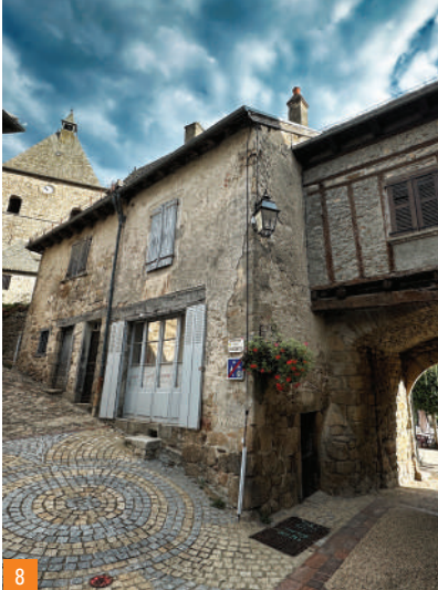
7. Maison Carrée / 8. Maison du Four accolée au Portail-Bas

n'accrochent le mur, ainsi que les anneaux d'attache pour les animaux.