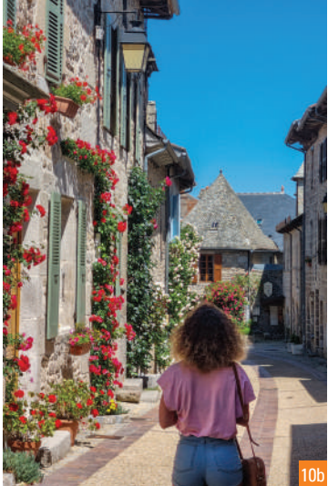
9. Faubourg Saint-Martin / 10a. Rue Longue et ses rosiers / 10b. Invitation à la flânerie dans la Rue Longue