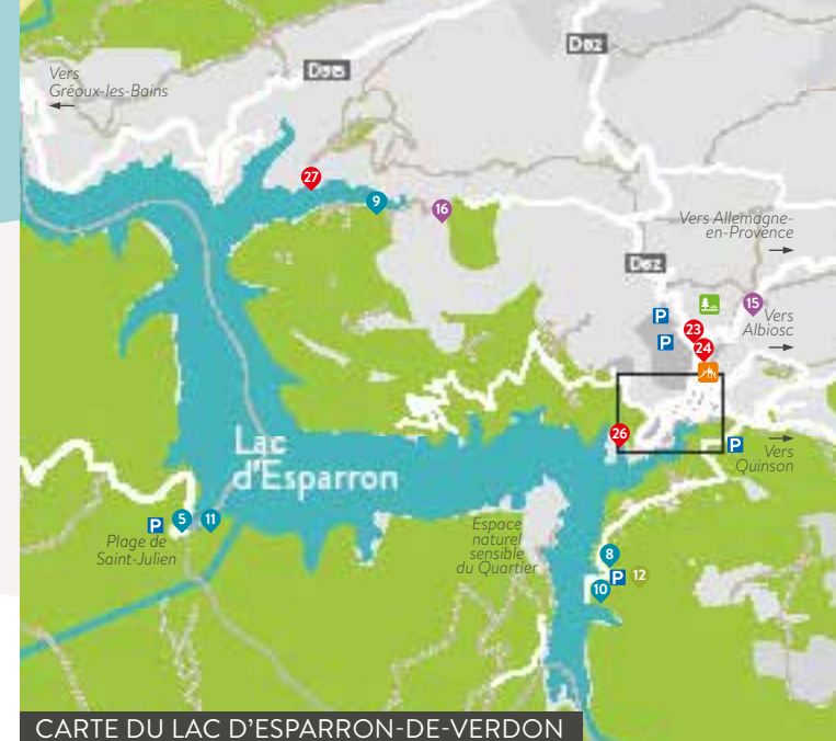
CARTE DU LAC D'ESPARRON-DE-VERDON