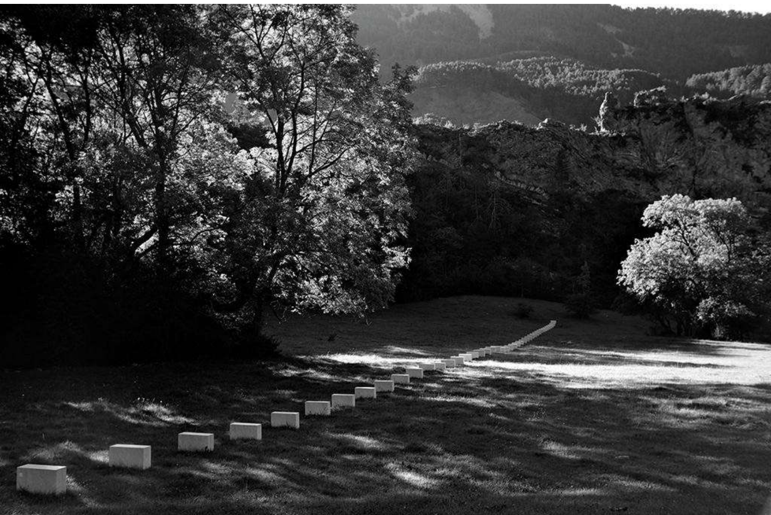
Vièze et les moyennes montagnes ©Richard Nonas

2025 : TOUTE L'ANNÉE AUX DATES DE VOTRE CHOIX