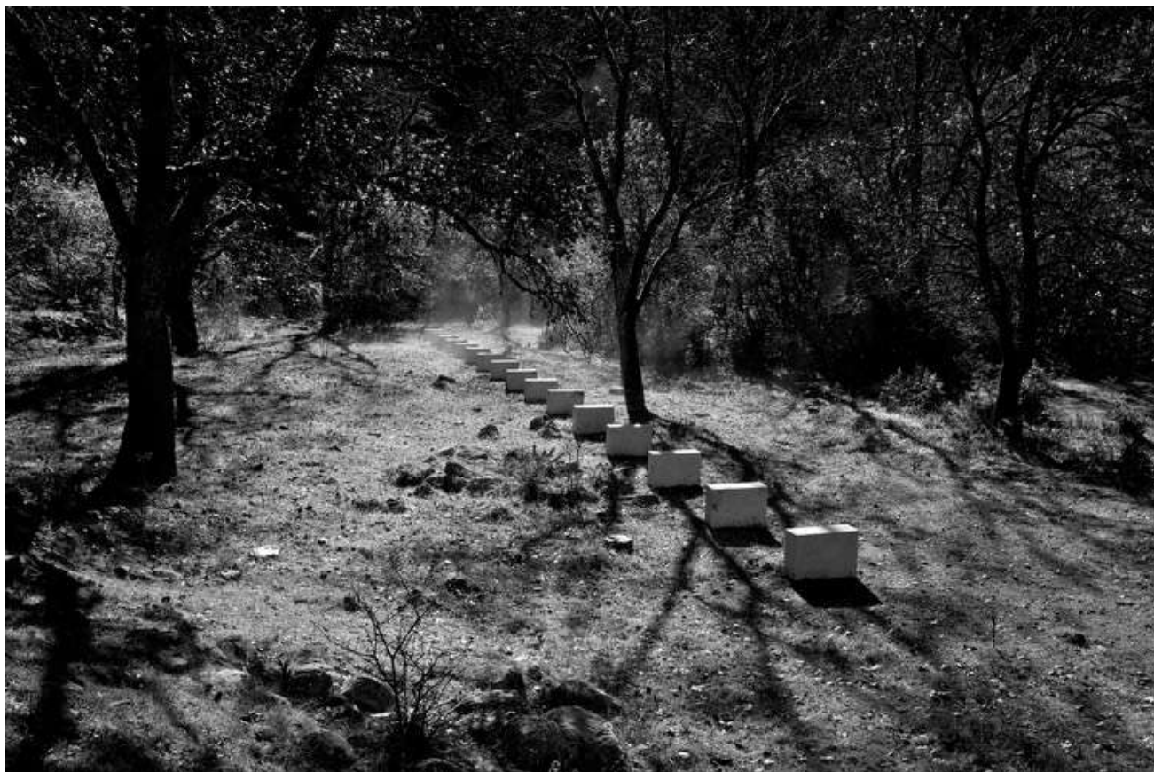
Vière et les moyennes montagnes ©Richard Nonas