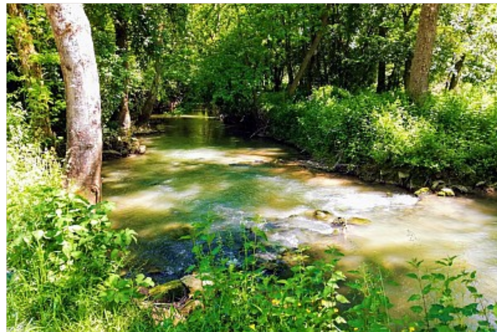
Coulommiers Pays de Brie Tourisme