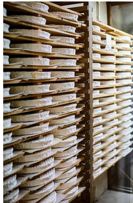
Coulommiers Pays de Brie Tourisme