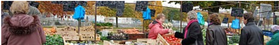
Ville de la Ferté-sous-Jouarre

Le mardi : Place de l'Hôtel-de-Ville Le vendredi : Boulevard Turenne Le dimanche : Place de l'Hôtel-de-Ville