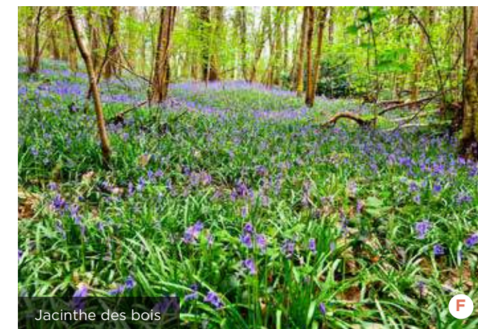
Jacinthe des bois