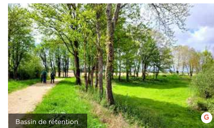
Bassin de rétention