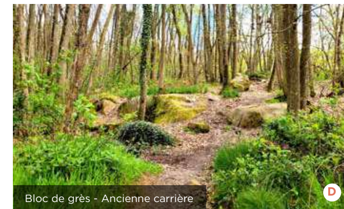
Bloc de grès - Ancienne carrière