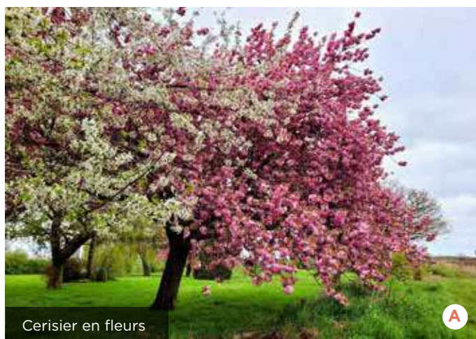
Cerisier en fleurs