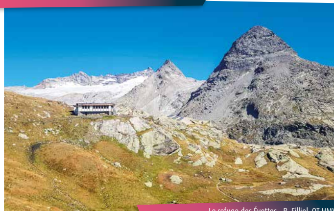
Le refuge des Évettes

Après une bambée à ne pas sous-estimer, le lac glaciaire du Grand Méan vous réserve des images sensationnelles. Des petits icebergs en haute Maurienne Vanoise? Tout simplement fascinant!