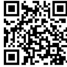
SiteWebFédération des AAPPMA du Cantal