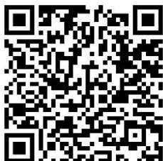
Téléchargement du présent règlement

Page Internet sur le site de la Fédération départementale de pêche et de protection du milieu aquatique : https://www.cantal-peche.com/annonce_aappma-aurillac_2_148_1_fr.html .