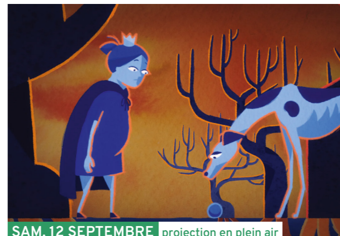
SAM. 12 SEPTEMBRE projection en plein air

Un jeune homme revient sur son parcours de rugbyman. Il nous partage son histoire, avec humour et tendresse : souvenirs de coach, de matchs mémorables, de blessures, de camarades, pour finir comme finit un match, avec les chants de la troisième mi-temps. Dans un rythme effréné, le comédien livre une performance tout aussi sportive que théâtrale, se soldant par des larmes de rire comme d'émotion.