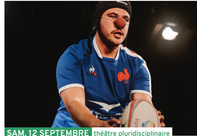
SAM. 12 SEPTEMBRE théâtre pluridisciplinaire

Radius est une petite marionnette curieuse du monde qui l'entoure, elle s'émerveille de tout, à commencer par les autres : leurs bouches, leurs oreilles, leurs nez. Mais un jour, elle réalise qu'elle n'arrive pas à voir son propre visage. Elle décide alors de partir à l'aventure pour trouver son reflet. Une quête sensible et sensorielle pour découvrir le chemin de soi à soi et de soi aux autres