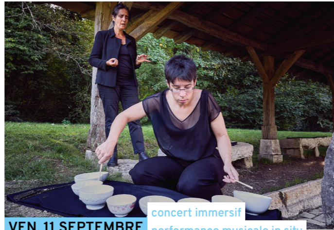
VEN. 11 SEPTEMBRE concert immersif performance musicale in situ