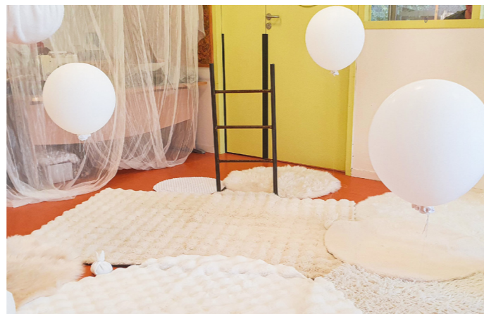
SAM. 12 SEPTEMBRE spectacle marionnette déambulatoire

* de l'association Résonance Contemporaine