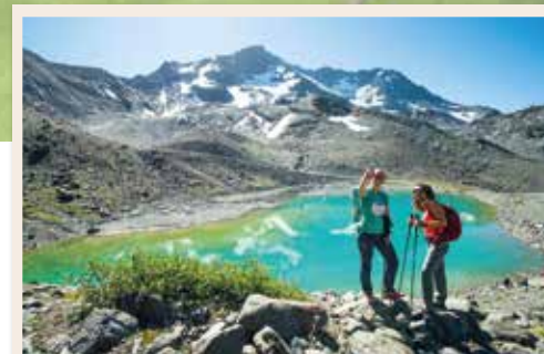
Lac Blanc Altitude 2 750 m - Randonnée n°18