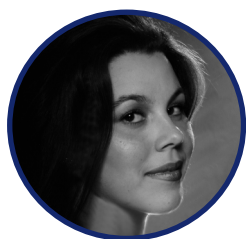
Irina De Baghy mezzo-soprano