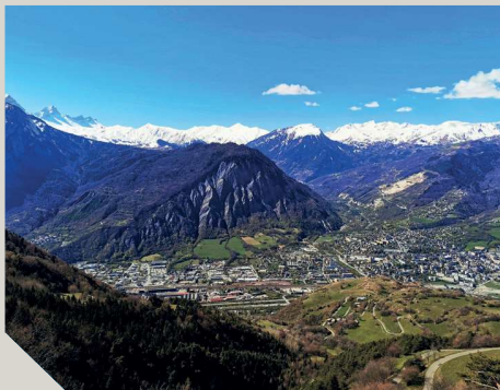
Point de vue entre Grenis et Champessuit