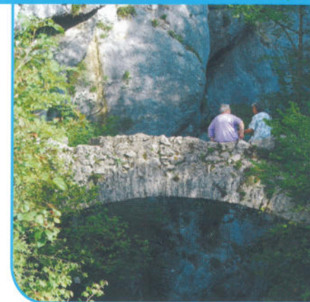
Le pont romain.