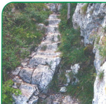
Escaliers taillés dans le rocher.

Les chasseurs du Mésolithique (8 500/8 000 avant J.C.), dans une forêt plus dense ou les chevreuils et sangliers sont en grand nombre, possèdent un outillage bien différent, traduisant l'évolution technologique due à l'invention de l'arc.