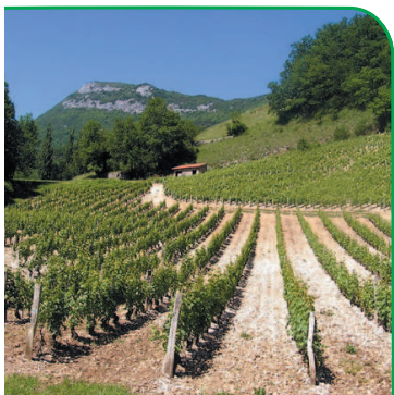
Le vignoble près de Monthoux