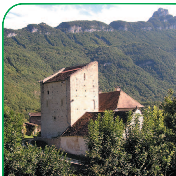
Maison forte de Prélian

Le pays de Yenne est reconnu pour ses 36 châteaux et maisons fortes. Leur vocation essentiellement agricole leur vaut aujourd'hui le titre plus conforme de "maisons nobles rurales". Ce n'est qu'à Saint-Jean-de-Chevelu, lieu de passage important (voies anciennes du col du Chat), que leur rôle défensif peut être identifié... on trouve d'ailleurs sur la commune pas moins de 10 édifices.