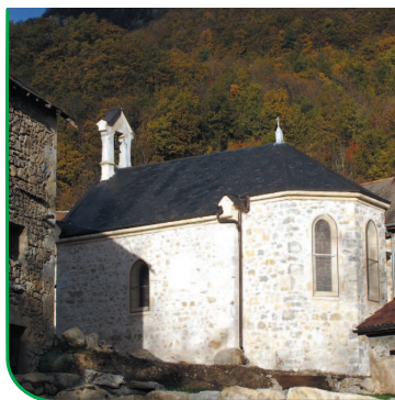
Chapelle de Monthoux

De cette maison forte située au dessus de l'église, subsiste une tour carrée massive au sommet tronqué. Cette tour dite "tour résidence" date du XII-XIIIème siècle. A l'origine, le rez-de-chaussée était une pièce aveugle réservée au stockage jusqu'au XVIe siècle ou elle fut percée d'une grande porte dotée d'un encadrement en plein cintre en molasse verte. Elle est accolée à un logis rectangulaire du XVIIème siècle, répondant à une nouvelle demande d'espace et de confort, et à une grange dotée de pignons à redents.