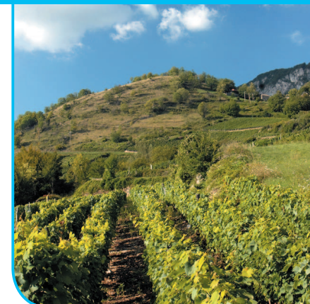
Le crêt de Monthoux et vignoble

IGN : TOP25 3332 OT "Chambéry-lac du Bourget"