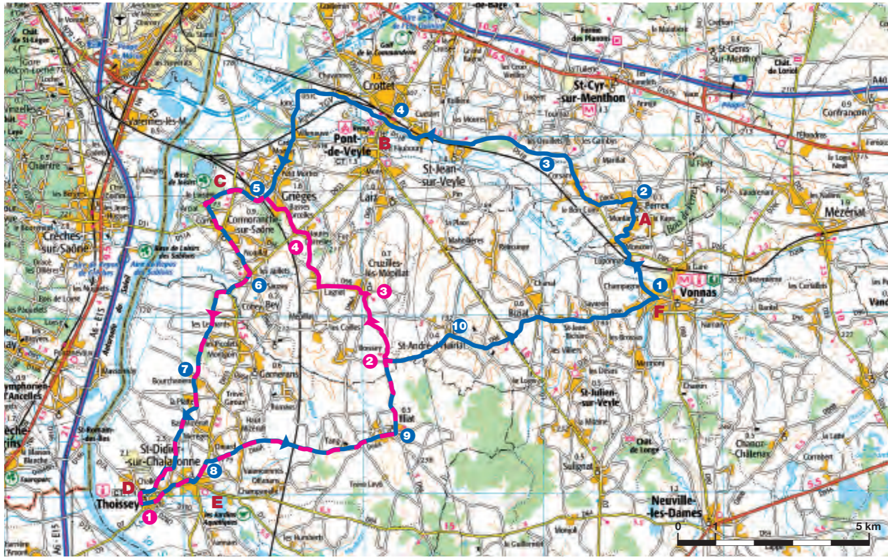
Cartes IGN 1 : 100 000 n° 44 et 51