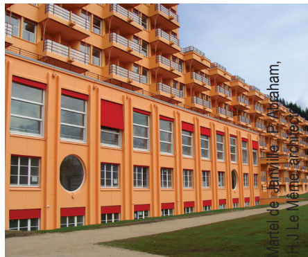
Marcel de Janyville, P. Aboham, H.J. Le Métel architectes

Cette église de renommée internationale a été fondée pour la population sanatoriale qui s'installée à partir de 1926. Bâtie par M. Novarina, consacrée en 1950 et décorée par les plus grands maîtres de l'art moderne, elle retrace l'histoire particulière du Plateau d'Assy. Grâce aux activités ludiques proposées, les élèves découvriront les principales œuvres, identifieront les matériaux utilisé par les artistes, et ainsi, développeront leurs connaissances dans le domaine des arts visuels.