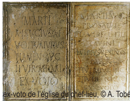
ex-voto de l'église du chef-lieu