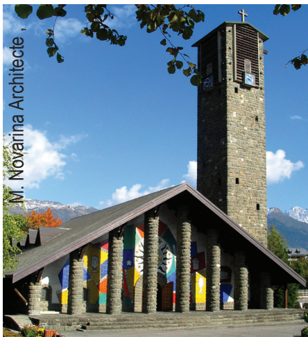
M. Novarina Architecte

Lieu : Plateau d'Assy Cycle : 1, 2, 3, collège, lycée Durée : 1h30 Outils pédagogiques : Livret et malette préparés avec l'IEN