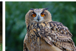
Loups et hibou Grand Duc du parc de Courzieu