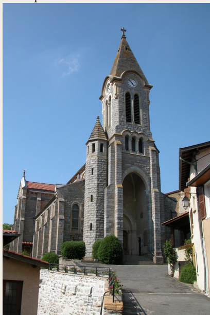
L'Église de Courzieu

patrimoine balisée dans le village ou sur les circuits de la Fraise sillonnant la commune : vestiges du bourg castral dépendant de l'abbaye de Savigny, monumentale église néogothique St Didier parée de granit, anciennes auberges et vieux pont du hameau des Hôtelleries, croix, chapelle, oratoire et château... Enfin Courzieu offre tous les équipements pour passer un séjour agréable : commerces, gîtes, restaurants, vente à la ferme, bike-park... Récemment récompensé par le jury du Label des Villes et Villages fleuris, Courzieu vous souhaite la bienvenue ! En savoir plus : www.courzieu.com/ et www.patrimoine-courzieu.fr/