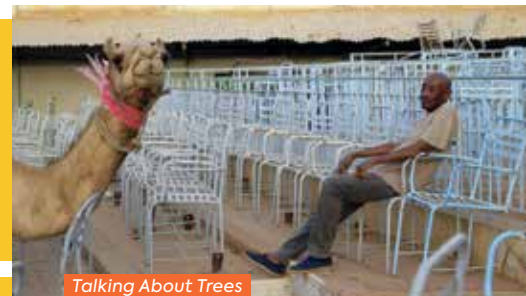
Talking About Trees