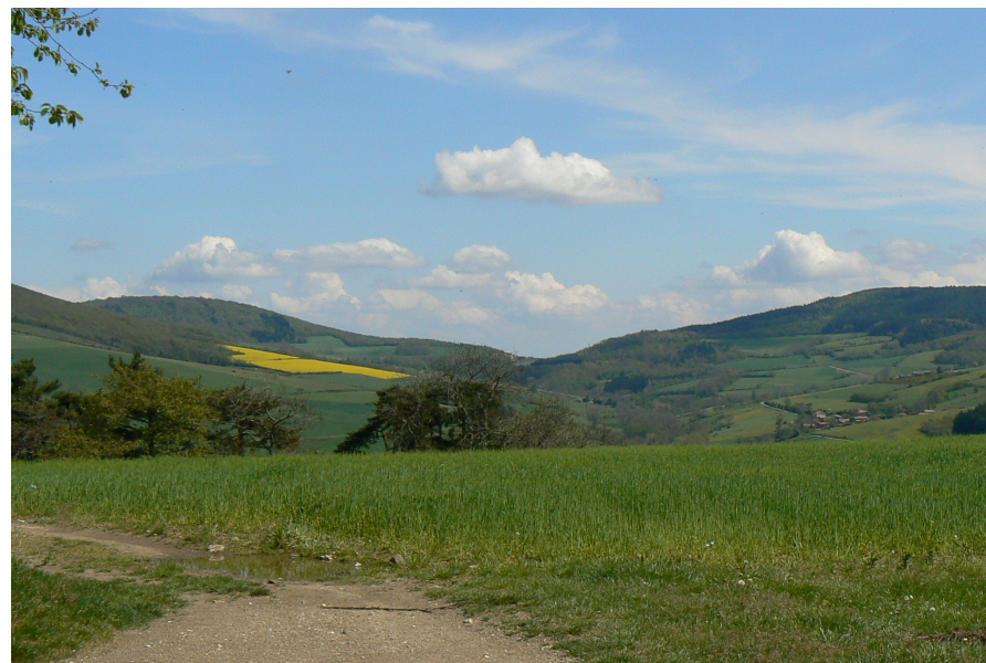
Vue sur le col de Grenouze

5 Croiser la D 78. Prendre à gauche le chemin goudronné qui rejoint Sainte-Croix-en-Jarez à l'entrée de la chartreuse.