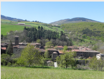
La chartreuse de Sainte-Croix-en-Jarez

funérailles de Thibaud de Vassalieu sont mises à jour. Elles sont datées de la première moitié du XIV e .