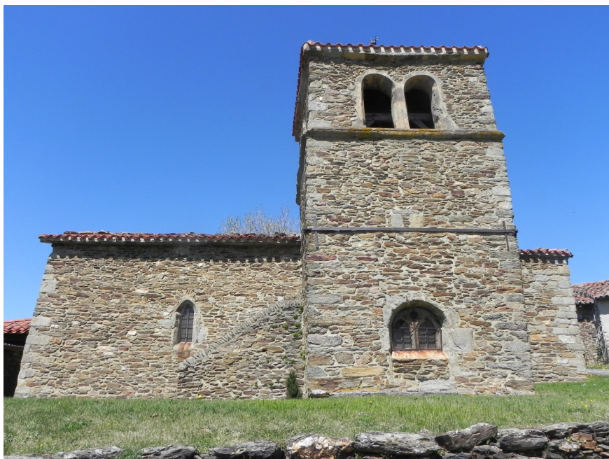
La chapelle de Jurieux

Caisse régionale de Crédit Agricole Mutuel Loire Haute-Loire - Société coopérative à capital variable, agréée en tant qu'établissement de crédit - Siège social situé 94 rue Bergson B.P. 524 42000 Saint-Etienne Cedex 1 - 360 366 854 RCS Saint-Etienne - Société de courtage d'assurance immatriculée au Registre des Intermédiaires en Assurance sous le n° 07 023 097.