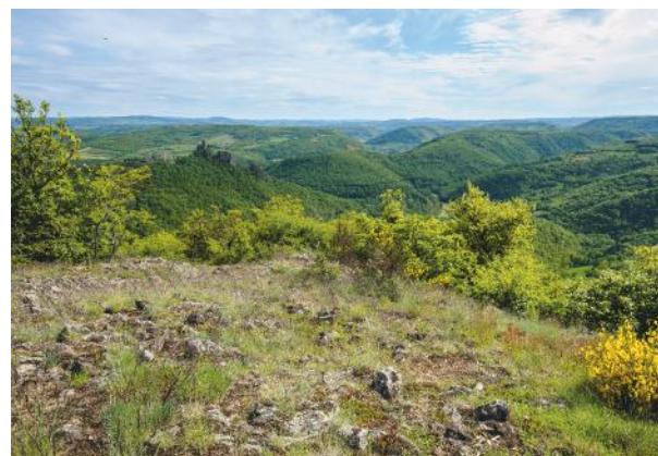
Depuis la coulée de Caure, vue imprenable sur le pays de Blesle. -JM-

D Dos à l'abribus, monter la route face à vous, passer au-dessus de Chambezon puis devant une ferme, monter à droite. Peu après, continuer sur la piste à droite pour quitter le village. 1 Délaissier un chemin à gauche et rester sur la piste principale ( vue sur Léotoing ) pour rejoindre le plateau. 2 À l'intersection d'une piste perpendiculaire, aller à gauche et continuer tout droit en délaissant un chemin à droite. Peu à peu, le sentier devient moins marqué et descend entre les chaos basaltiques. Traverser le ruisseau et rejoindre une piste que l'on suit à gauche. 3 Au niveau de la voie ferrée, aller à gauche. 100 m plus loin, dépasser un pont et continuer en face pour longer la voie. Rejoindre Chambezon, passer devant le cimetière et avancer tout droit dans le village. Devant l'abribus, aller à gauche pour rejoindre le point de départ.