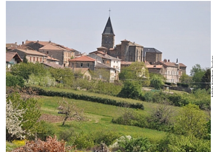
Ardeche Hermitage Tourisme