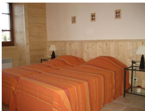
Chambre avec 2 lits 1 personne