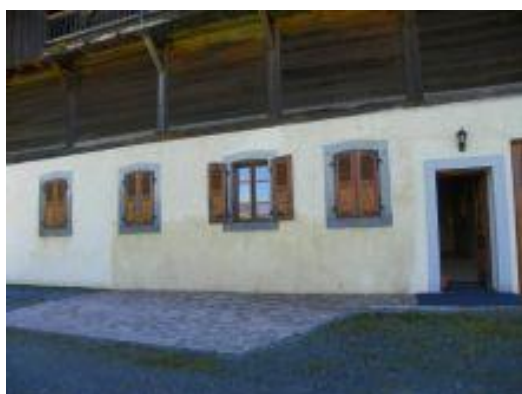
Vue principale de la Ferme de Oise