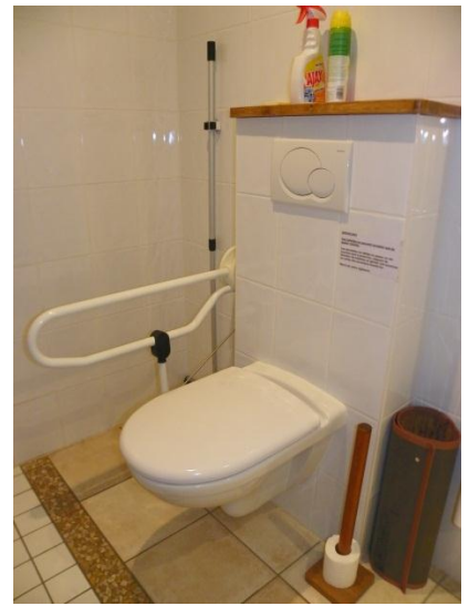
Salle d'eau avec douche, wc et lavabo