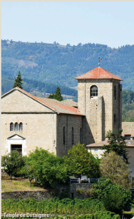
Temple de Désaignes