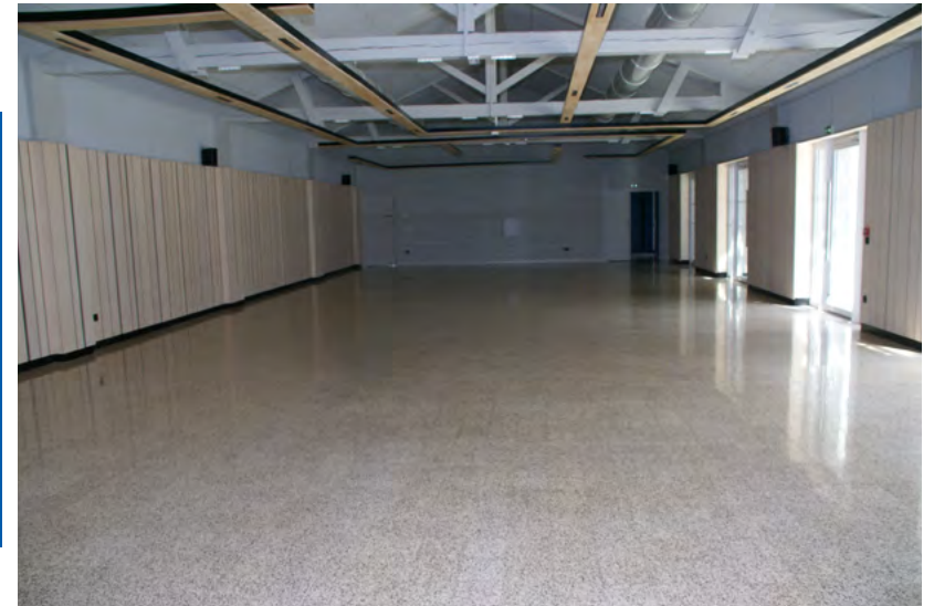
Vue de l'entrée

150 personnes tables rondes de 10 couverts