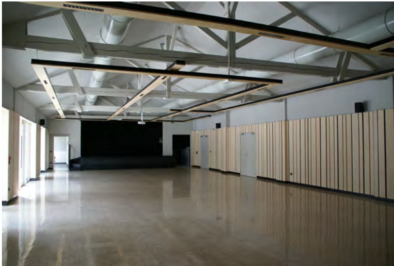
Vue de la scène

Dans sa continuité, un espace entièrement vitré offre son beau volume et sa transparence. Nous pénétrons dans la salle de spectacle, d'amples dimensions et comportant une scène surélevée de quelques marches, à laquelle des personnes à mobilité réduite peuvent accéder grâce à son monte-personne.