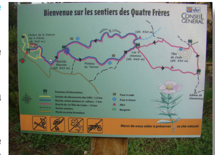
Panneau d'informations sur les sentiers