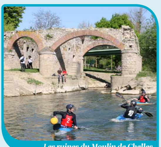
Les ruines du Moulin de Chelles

Office de Tourisme de Paris - Vallée de la Marne 51bis, avenue de la Résistance - 77500 CHELLES 01 64 21 27 99 - tourisme@aglo-pvm.fr - www.tourisme-pvm.fr