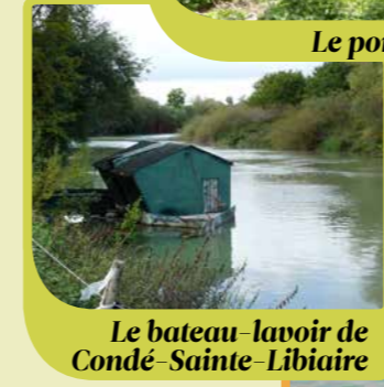
Le bateau-lavoir de Condé-Sainte-Libiaire