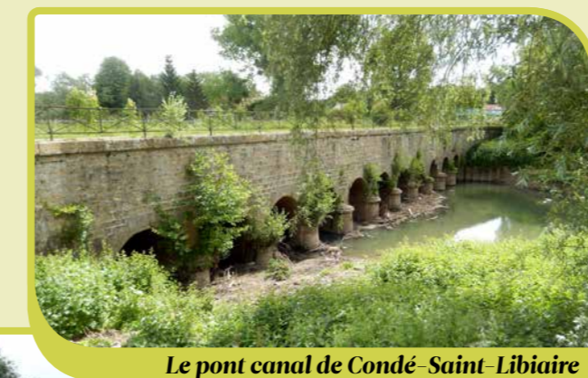
Le pont canal de Condé-Saint-Libiaire

Maison du Tourisme du Pays Créçois 1, place du Marché - 77580 CRÉCY-LA-CHAPELLE 01 64 63 70 19 - tourisme@payscrecois.net www.cc-payscrecois.fr/La-Maison-du-Tourisme