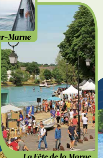
La Fête de la Marne

À voir également Maison natale de Louis Braille 13, rue Louis Braille 77700 COUPVRAY 01 60 04 82 80 www.brailletourisme.org/louis_braille/maisnat.htm