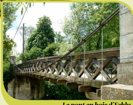
Le pont en bois d'Esly