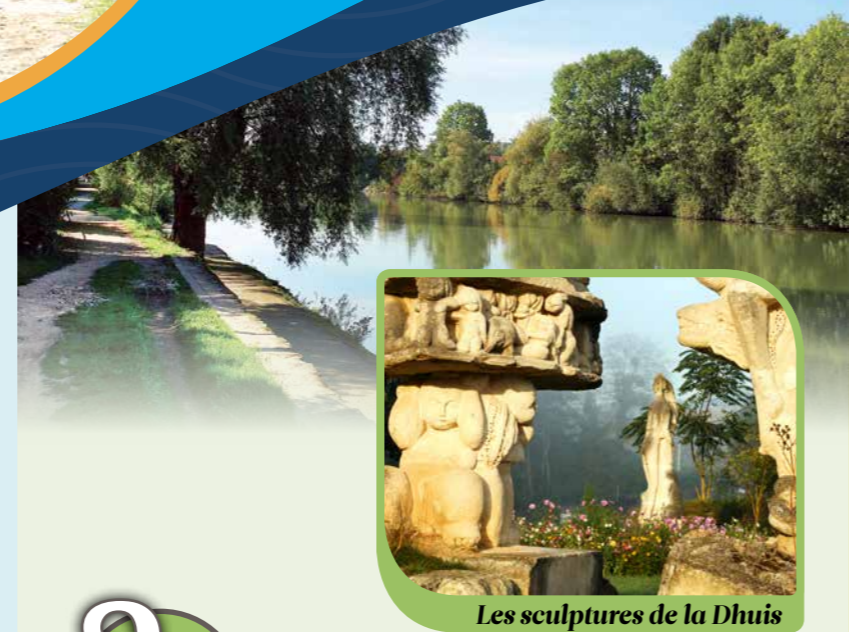
Les sculptures de la Dhuis