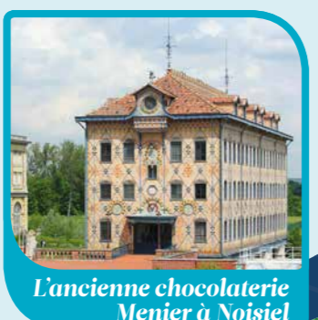
L'ancienne chocolaterie Menier à Noisiel