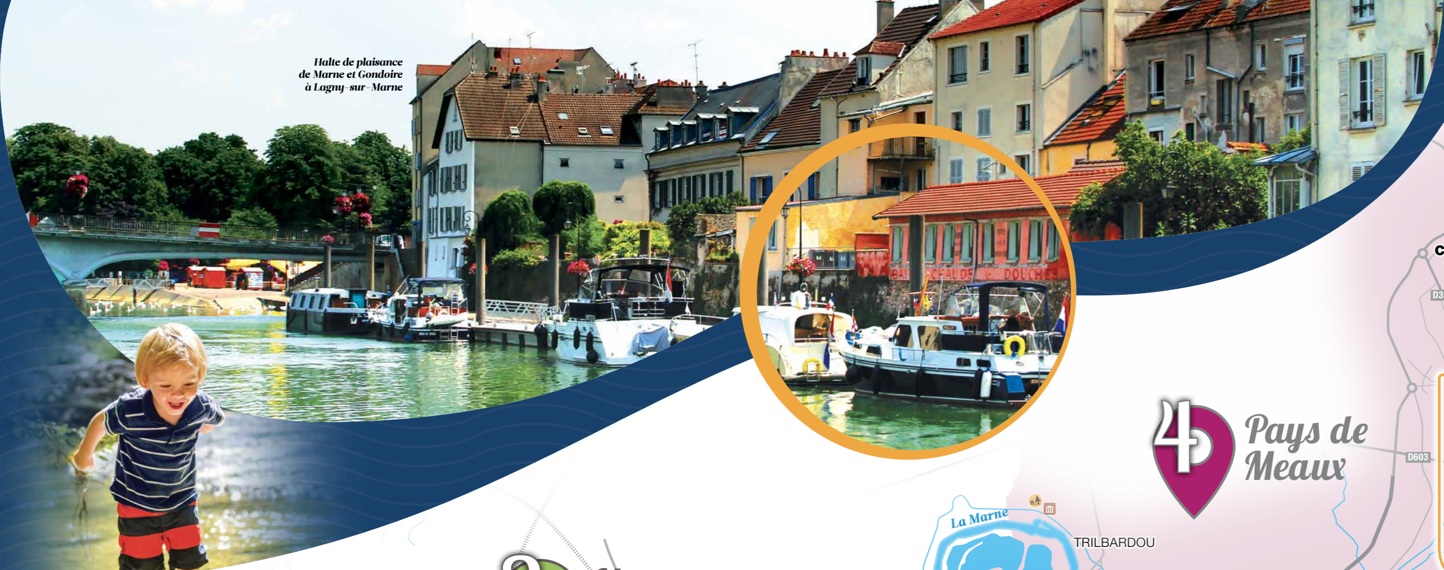
Halte de plaisance de Marne et Gondoire à Lagny-sur-Marne