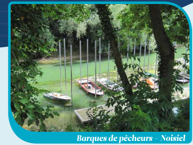
Barques de pêcheurs Noisiel