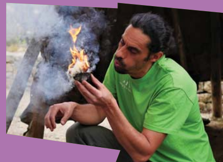
Les Secrets du Feu