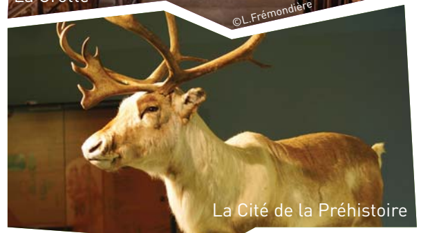
La Cité de la Préhistoire