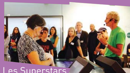
Les Superstars d'Ardèche

Durée : 1h15. A partir de 14 ans. Tarifs : 2,5€/adulte, 1,5€/adolescent. Inscription sur place lors de l'achat du billet. - Tous les jours, jusqu'au 31 août à 11h15.