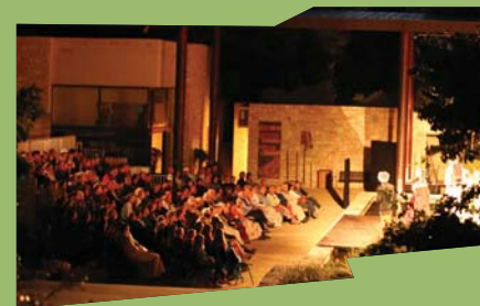
Théâtre sous les étoiles

Tous les soirs de l'été (sauf relâches les lundis et dimanches). Durée : 1h15 environ. Tarifs : 15€/adulte, 10€/enfant - de 16 ans. Réservation obligatoire au 07 68 24 63 64 ou sur le site www.athomecollectif.com . - Tous l'été, du 14 juillet au 27 août : du mardi au samedi à 21h30.