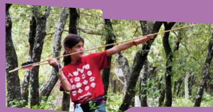
Atelier chasse