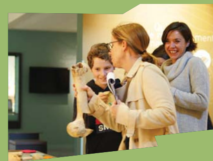
Enquête criminelle