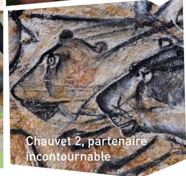
Chauvet 2, partenaire incontournable