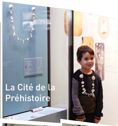
La Cité de la Préhistoire