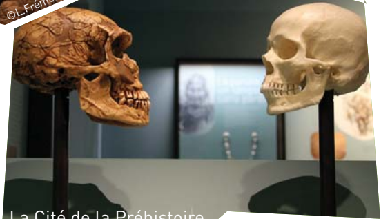
La Cité de la Préhistoire