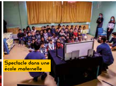
Spectacle dans une école maternelle