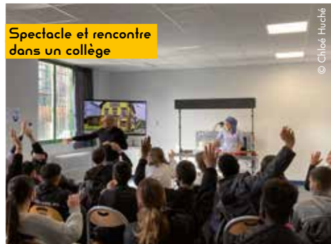
Spectacle et rencontre dans un collège