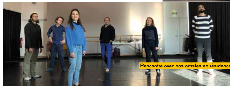
Rencontre avec nos artistes en résidence