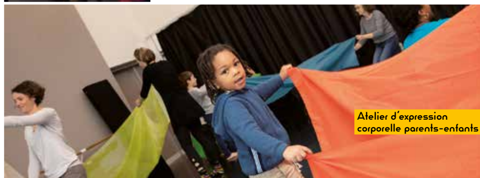
Atelier d'expression corporelle parents-enfants

Et bien d'autres propositions accessibles à tous : spectateurs solo, en famille ou entre amis !