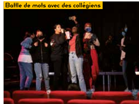
Battle de mots avec des collégiens