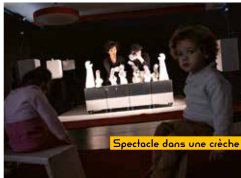
Spectacle dans une crèche