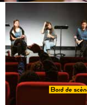
Bord de scène

Retrouvez tous les événements programmés en parallèle des spectacles et les supports pédagogiques réalisés sur lefigurierblanc.argenteuil.fr et sur les réseaux sociaux !