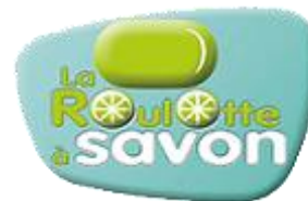
La Roulotte à Savon