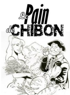
Le Pain de Chibon