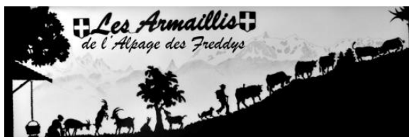
Les Armaillis de l'Alpage des Freddys