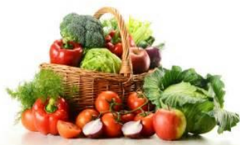
Les légumes des Coteaux de PASSY