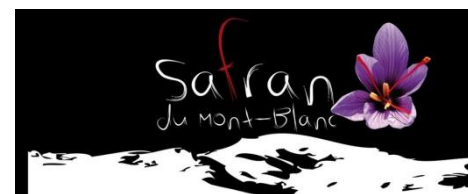
Le safran du Mont-Blanc