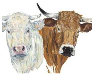
La Ferme Victorine