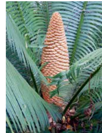
Cycas seemanii femelle