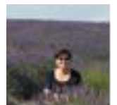
Cécile L'Oustaou du Luberon

Organisé NaturoFlow & L'Oustaou du Luberon