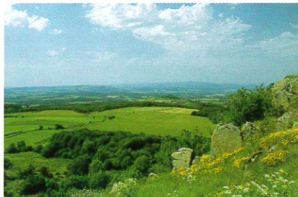
Aux environs de Lastic.

pierres, vue sur l'ancien moulin de Chantegrès). 6 Sous la première maison de Lastiguet, descendre à droite. Franchir la rivière sur une passerelle. Prendre à droite et s'élever. Par deux fois, prendre à gauche et rejoindre la route. 7 La suivre à droite sur 50 m. Tourner à gauche sur un chemin et retrouver la route. La suivre en face en direction de Lastic et gagner le point de départ.