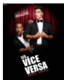
Les Vice Versa