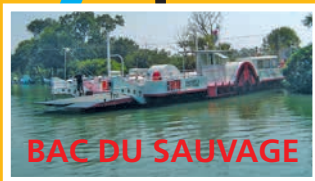
BAC DU SAUVAGE