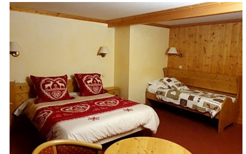
Hôtel Le Mont Bisanne

Période d'ouverture : Du 24/04 au 22/10/2021 Ouverture tous les jours de 16h à 22h. Du 23/10/2021 au 22/04/2022, tous les jours. Du 23/04 au 21/10/2022, tous les jours.