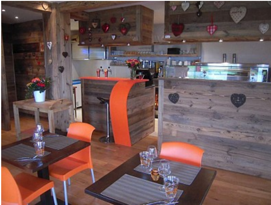
oti Val d'Arly

Restaurant, pizzeria à l'année, menu, pizzas à emporter.