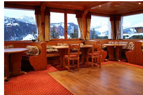
Hôtel Le Mont Bisanne

Pour vos repas vous disposez de deux salles, la première sur le front de neige avec une grande terrasse ensoleillée, la seconde avec une vue panoramique sur le Mont Charvin