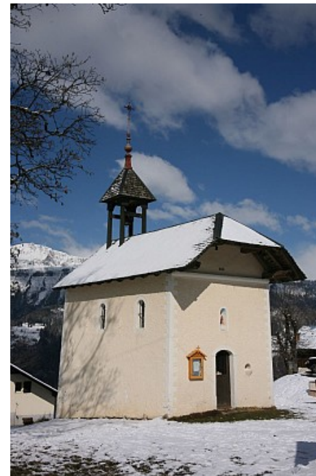
OTI Val d'Arly

Simple oratoire en 1663, la chapelle dédiée à saint Aubin et saint François de Sales est bénie en 1668. Sur la façade une niche, un bénitier et la date de bénédiction. Le toit en tavaillon est orné d'un clocheton pyramidal ouvert.