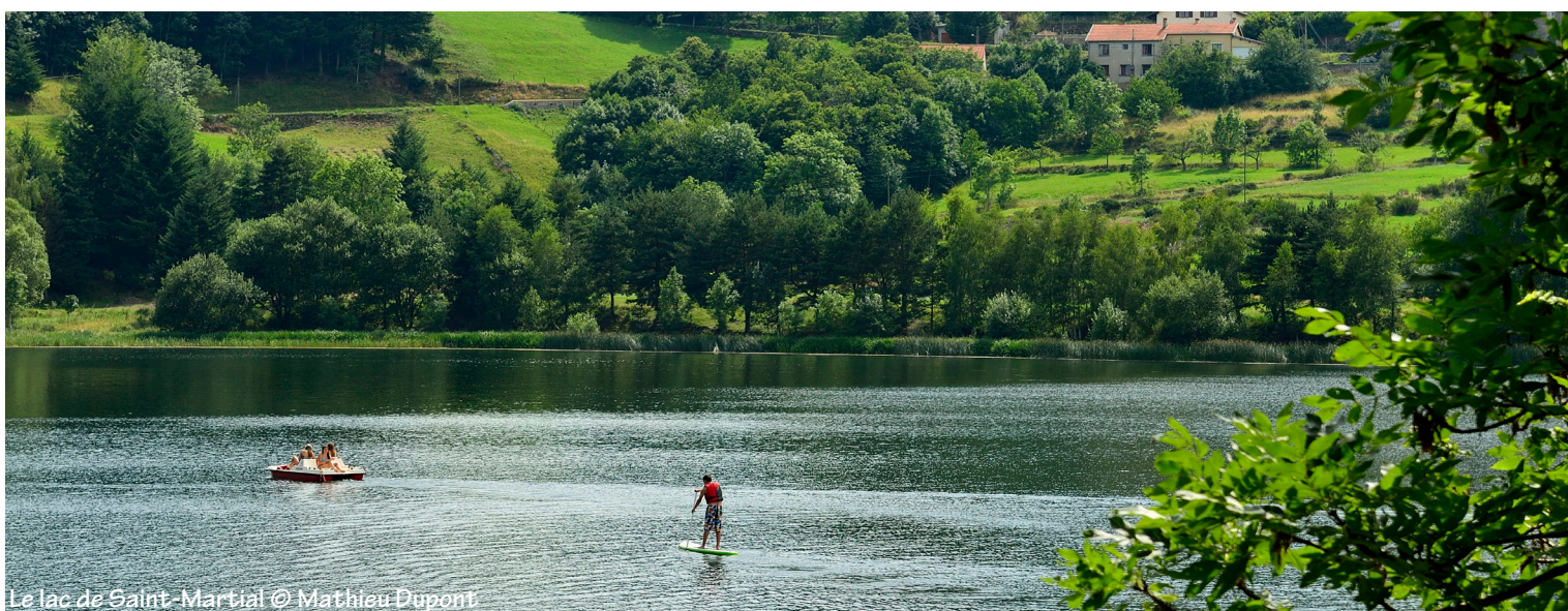
Le lac de Saint-Martial