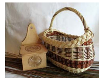
Bois & liens