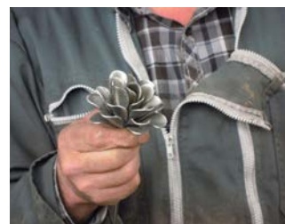
Art de Fer

Informations et autres idées de visites sur www.chartreuse-tourisme.com/rsf ou sur la carte de la Route des Savoir-Faire et des Sites Culturels (disponible gratuitement dans les offices de tourisme du massif).