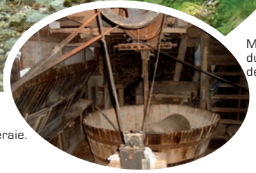
Moulatou du Moulin de Raoul