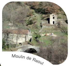
Moulin de Raoul

Balissage : jaune et blanc (et jaune et rouge). Attention ! les châtaigneraies sont exploitées : merci de respecter les cultures et de ne pas ramasser de fruits.