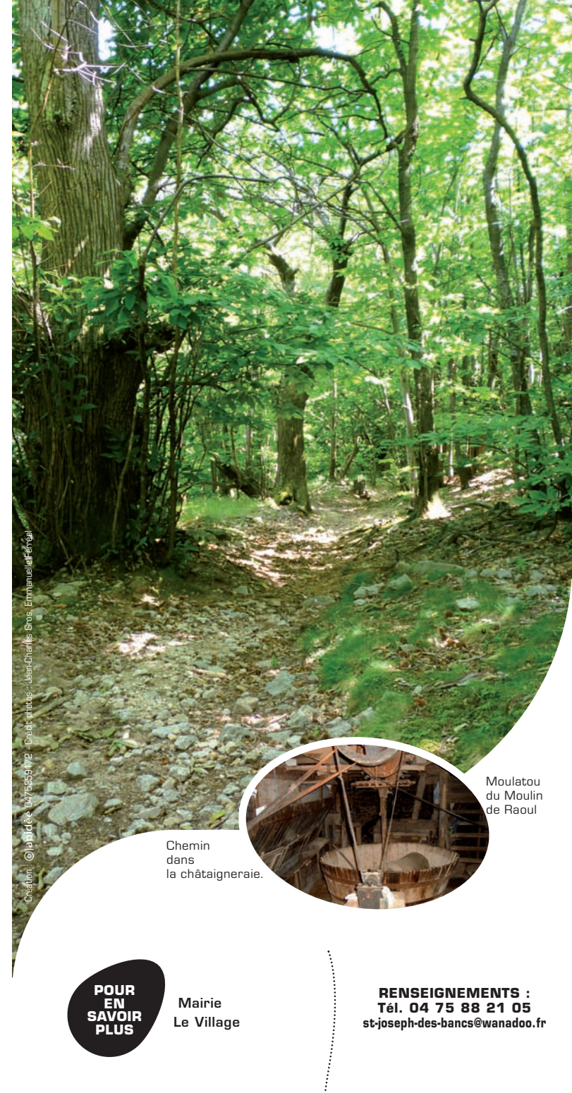
Création : © la photo - 04/75/559 012 - Crédit photos : Jean-Charles Gros, Emmanuel Féréal

Franchissez le petit pont, passez entre les maisons du hameau du Mazel et, par la route de droite, rejoignez l'intersection. Prenez la route à gauche sur environ 10 m et montez par le sentier de droite à travers les châtaigniers jusqu'au village de Saint-Joseph-des-Bancs .