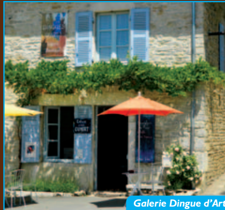
Galerie Dingue d'Art