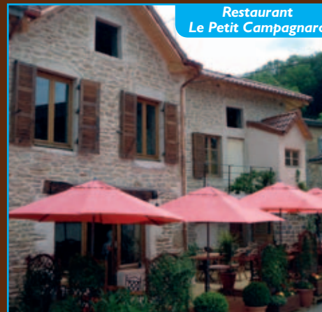
Restaurant Le Petit Campagnard