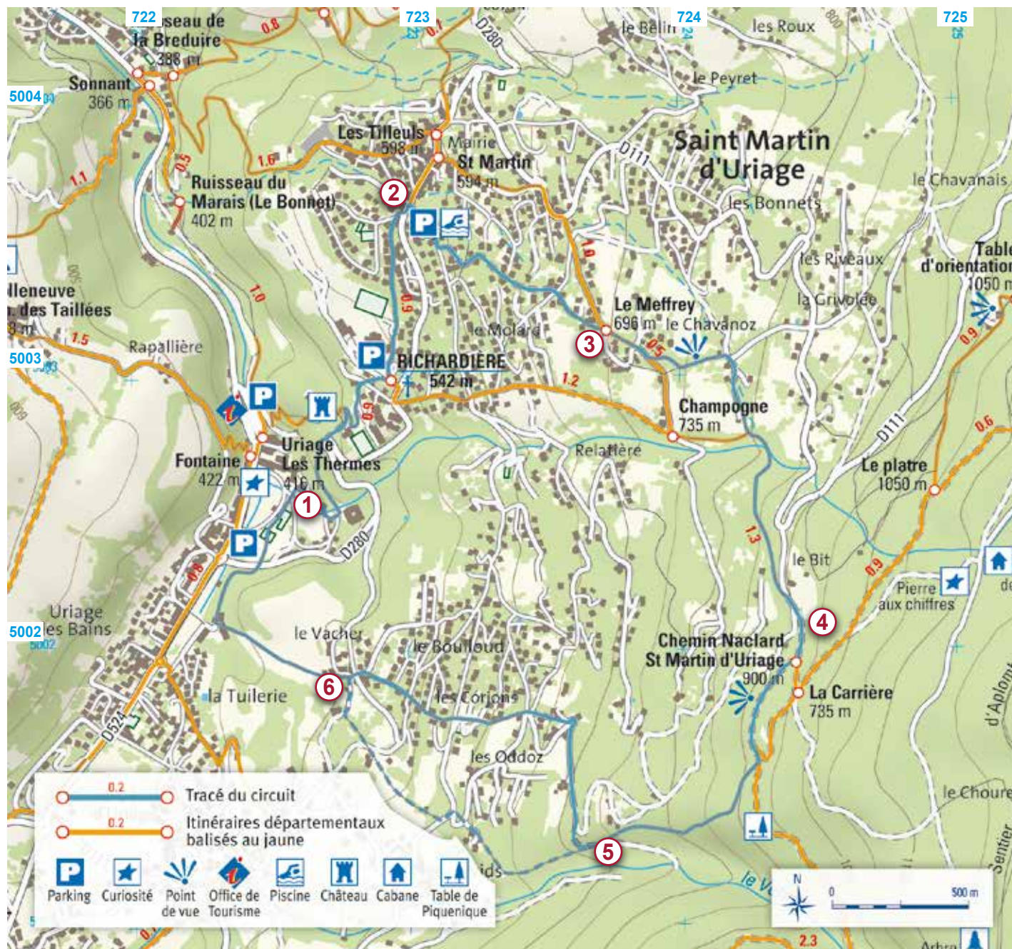
Les croisillons bleus correspondent au carroyage kilométrique UTM-WGS84 - Carte Mogoma

④ Alt. 910 m ➔ Avant de poursuivre notre itinéraire à gauche on peut aller pique-niquer sur une table en prenant à droite cette petite route sur 150 m. Retourner sur ses pas direction Nord (vue magnifique sur la Chartreuse, le Vercors et la vallée de la Barque), laisser une première piste forestière à droite puis au croisement une autre large piste forestière, continuer tout droit avant de prendre à gauche un chemin en descente (nous sommes au Bit). Ignorer à gauche deux chemins, et continuer à descendre jusqu'à une route goudronnée qui débouche à un croisement (intersection avec le circuit du Roux).