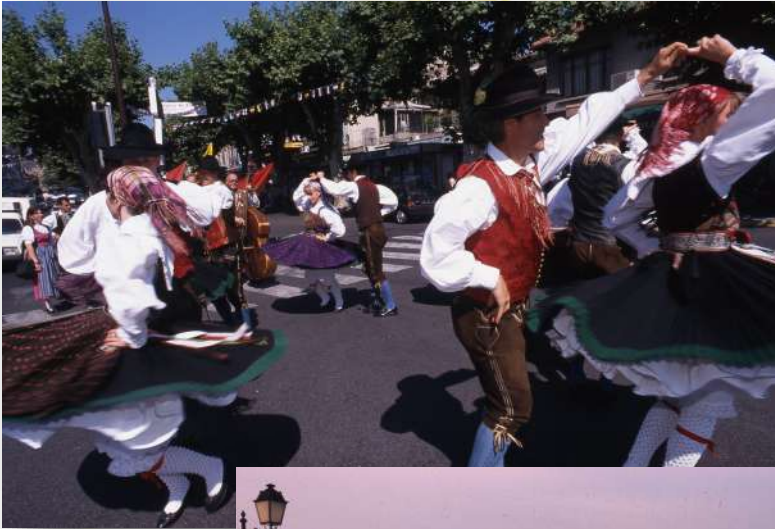
Le groupe autrichien « Edelweiss » sur la place Pasteur lors du festival Aquarelle en 1998