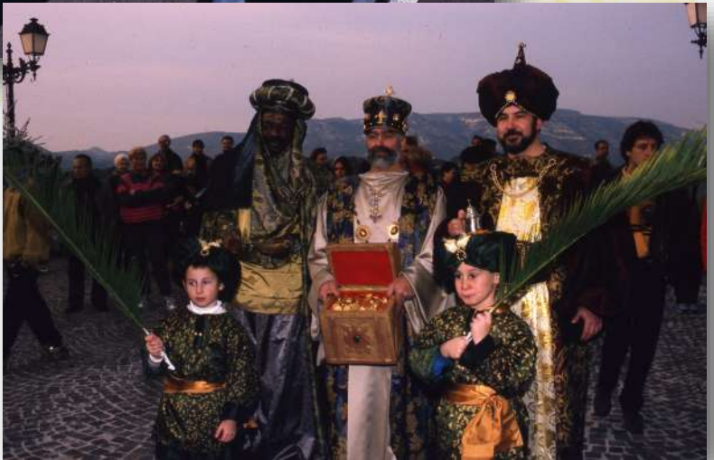
Première Marche des Rois à Aubagne, 08/01/2000