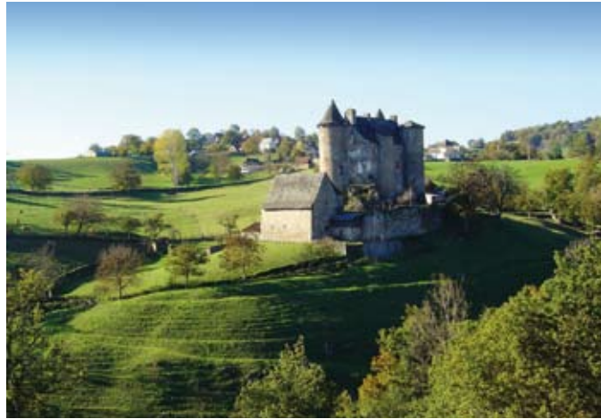
Château de Sénezergues

Sénezergues est un petit village pittoresque irrigué par de nombreux ruisseaux qui viennent grossir la rivière L'Auze.